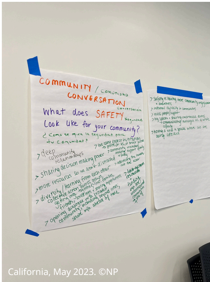
California, May 2023.