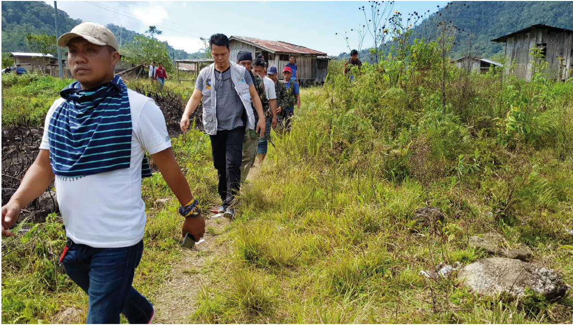
Surveillance et vérification du cessez-le-feu aux Philippines, NPP