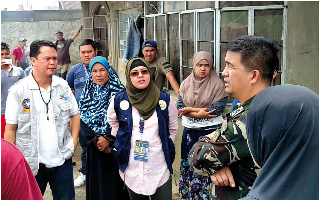
Reaktion auf die Marawi-Krise 2018 auf den Philippinen, NPP