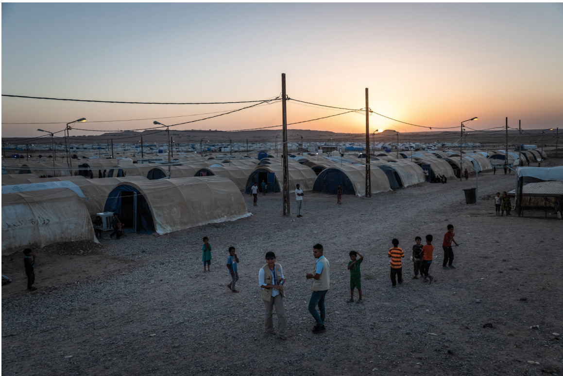
NP Schutzbeauftragte besuchen das "Haman al Alil" - Camp 1 während einer Abendpatrouille