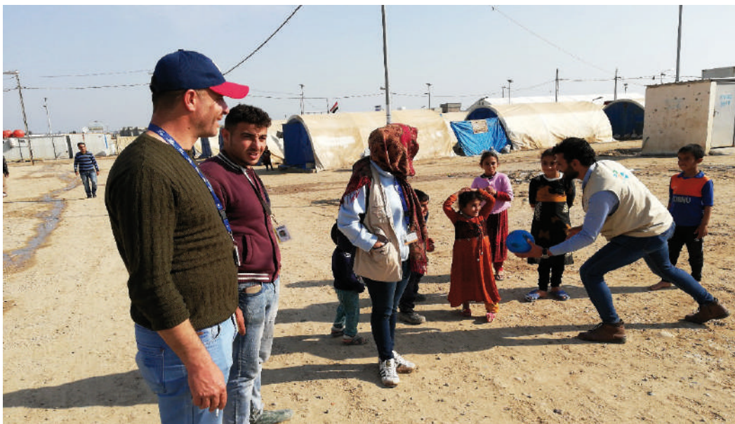
L'équipe de NP échange avec des enfants lors d'une patrouille dans un camps de déplacés en Irak, NPIQ 2018