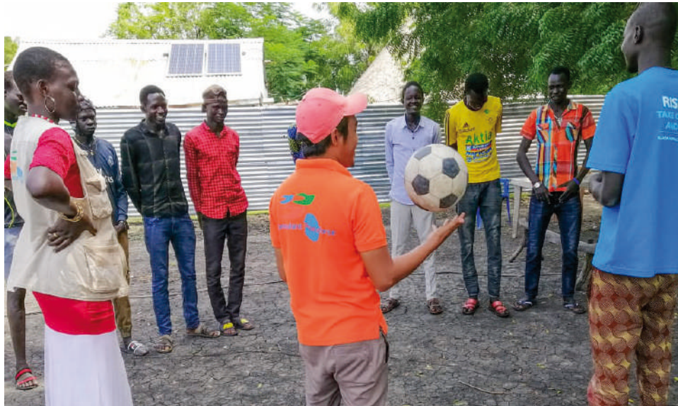
Formation des jeunes à la gestion de la colère au Sud Soudan, NPSS 2020